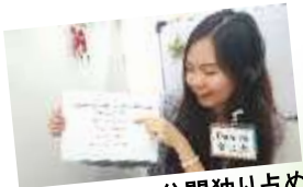
▲先生を 25 分間独り占め

通常授業は、数学と理科の演習を中心に行います。中学校の理数科目は、宿題と復習がポイントです。学校で学習したことを中心に、フォローし、疑問点を確実につぶし、定着を図ります。