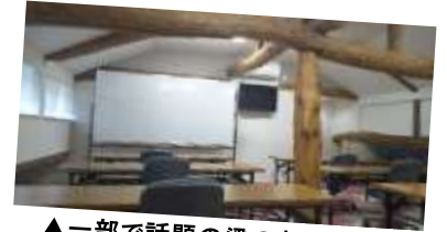
▲一部で話題の梁のある教室